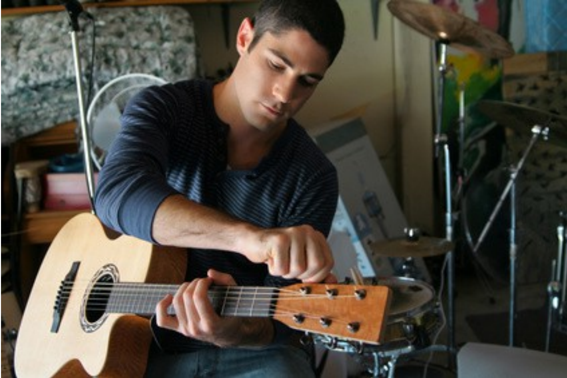
Vous êtes musicien avant tout

rythme et le mouvement, la durée des chansons et votre façon de composer un album.